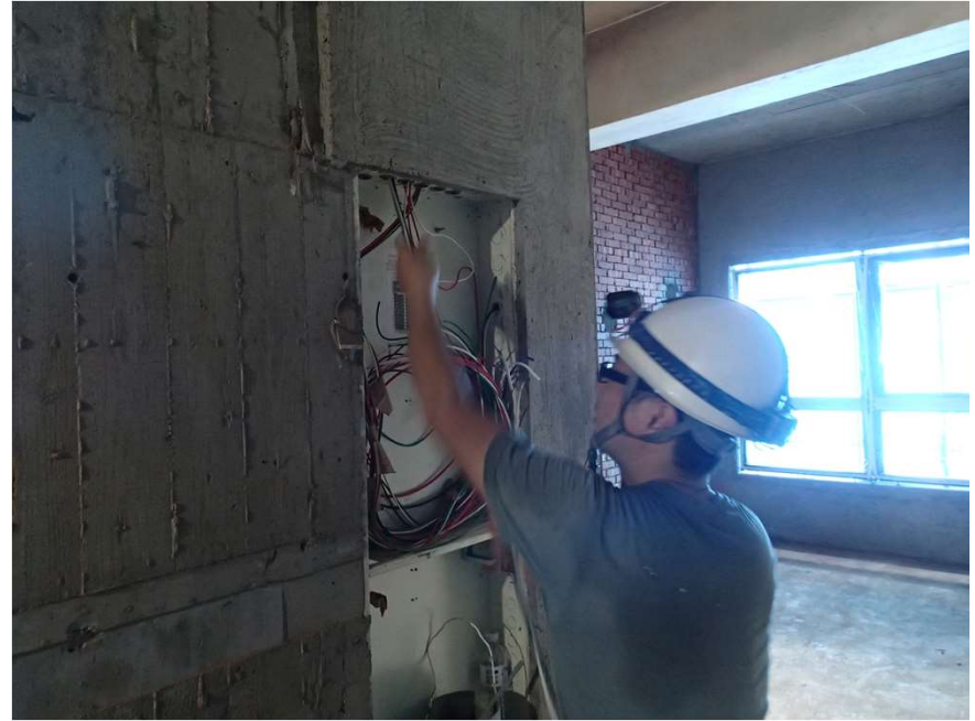
各戶平頂電燈位置拉電線