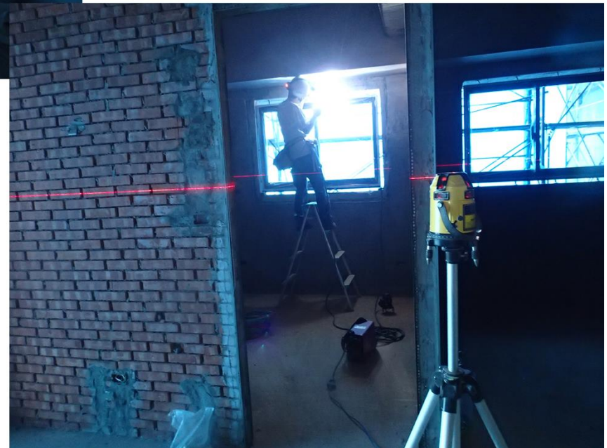
各樓層各戶鋁窗安裝