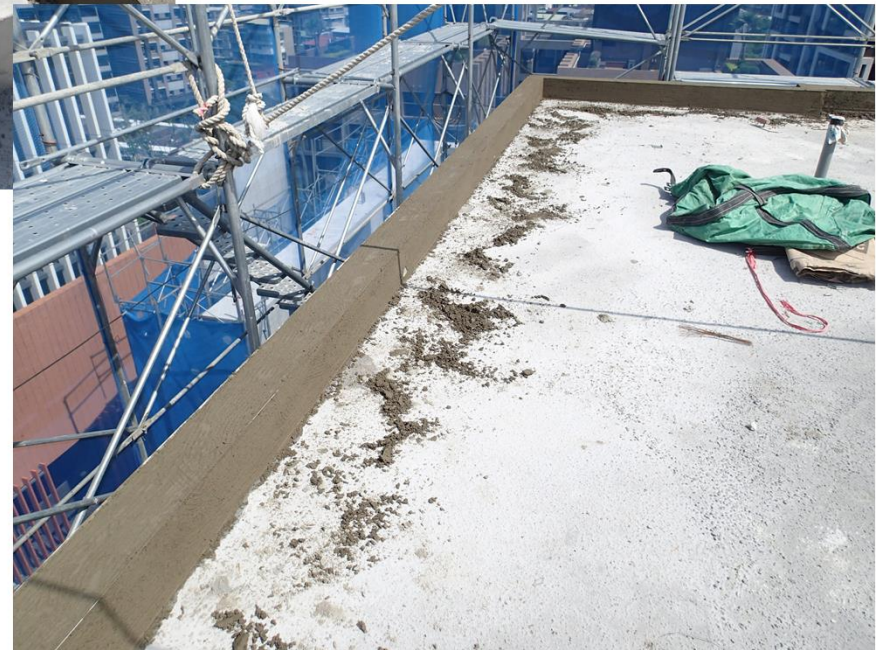
屋頂頂部墩座及外牆泥作打底