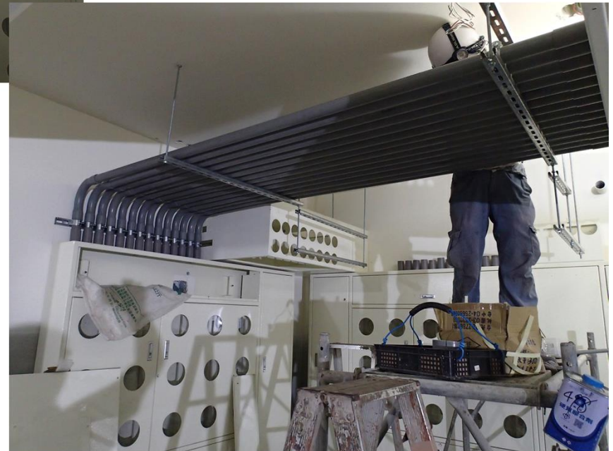
B1F坪頂接線箱安裝固定及配管 (各戶電錶之穿電纜線用)