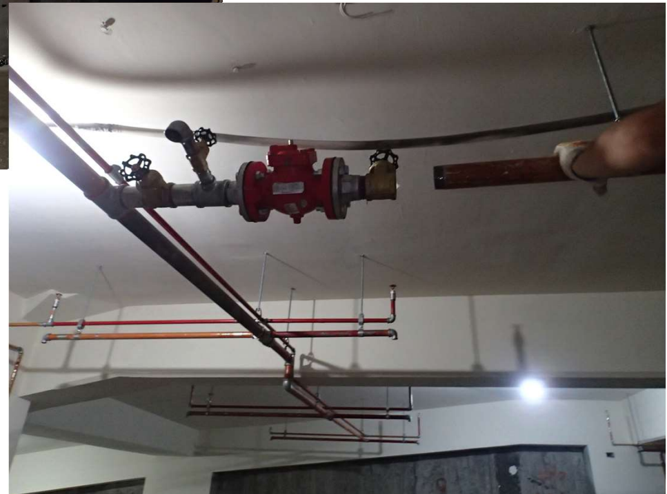
地下室消防管吊管施作