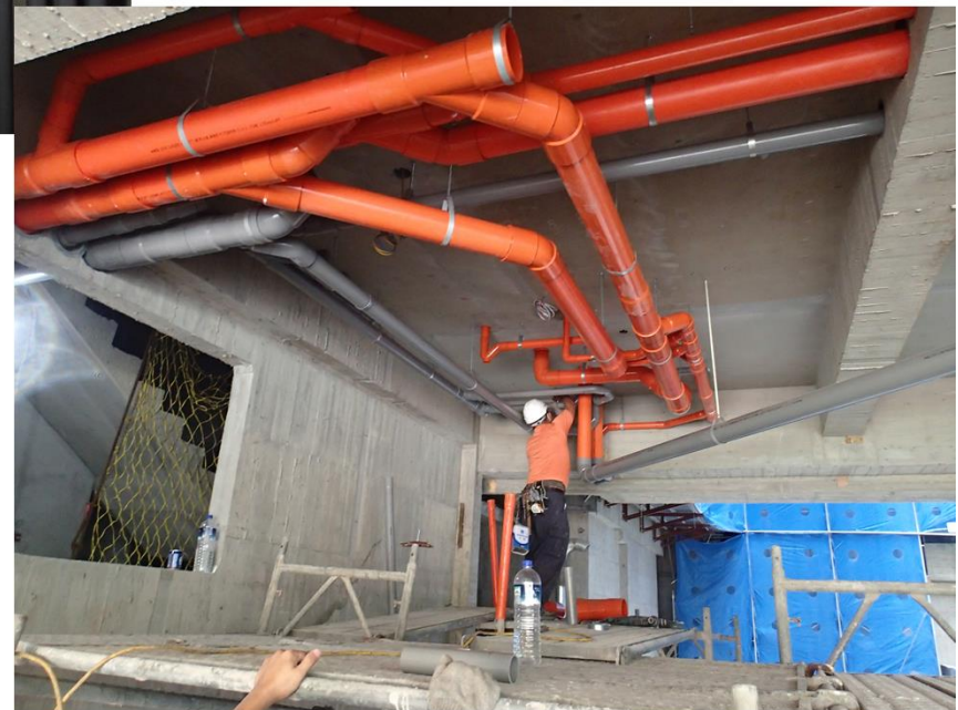
1樓車道上方排水吊管施作