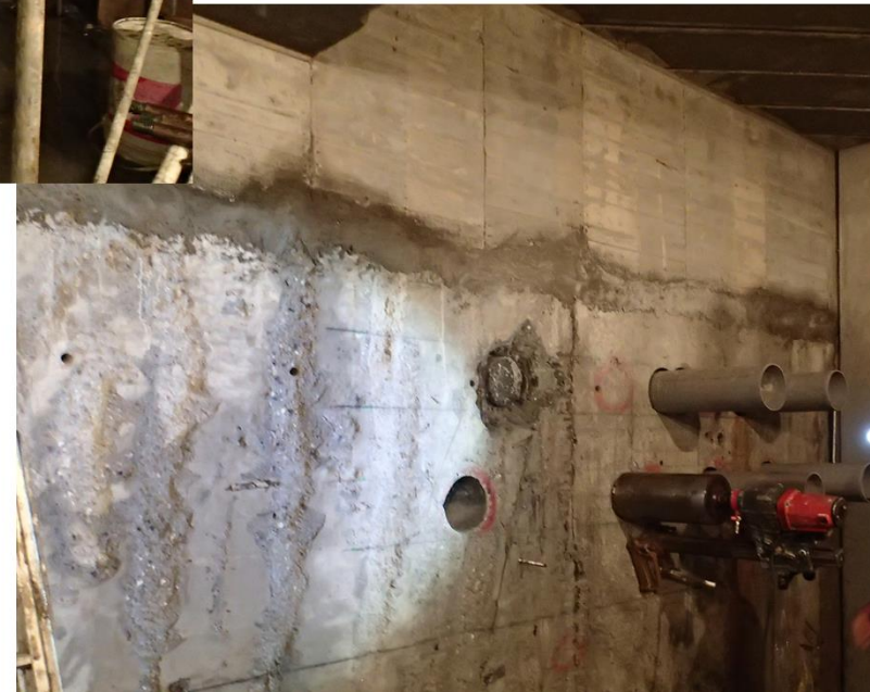
B1F台電受電室內連續壁壁面洗孔(台電電纜進入孔)