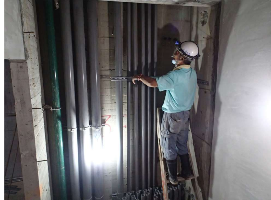
樓梯管道間各戶電管配管