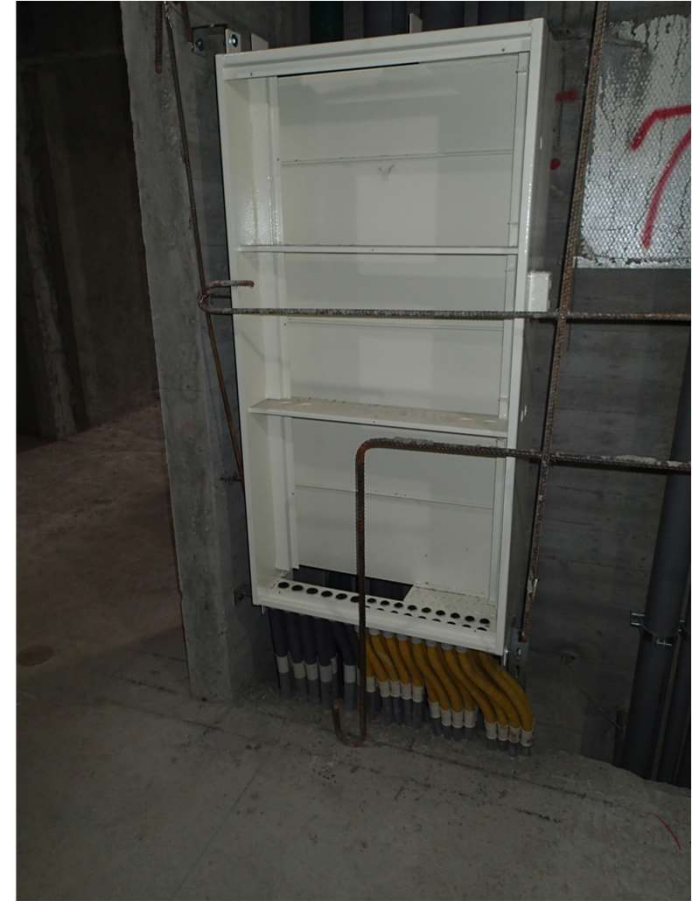
樓梯管道間弱電箱配管,弱電箱組立 安裝固定