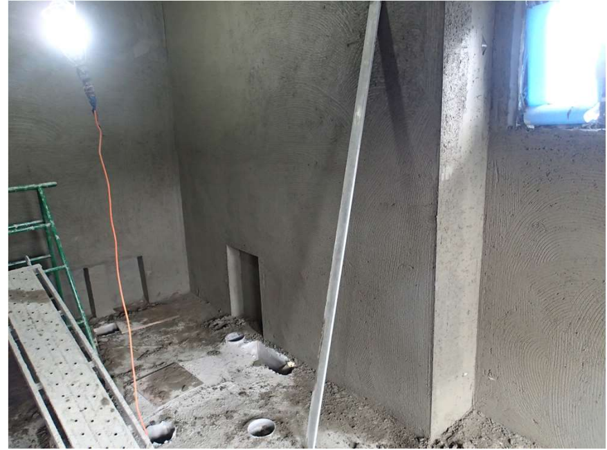
R3F室內牆泥作打底施作