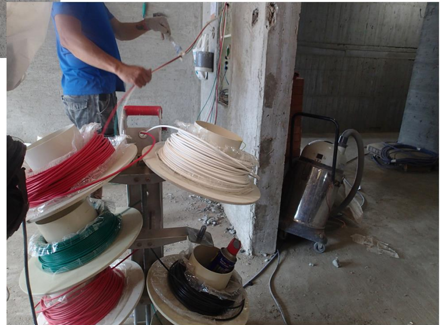
各戶開關箱拉電線