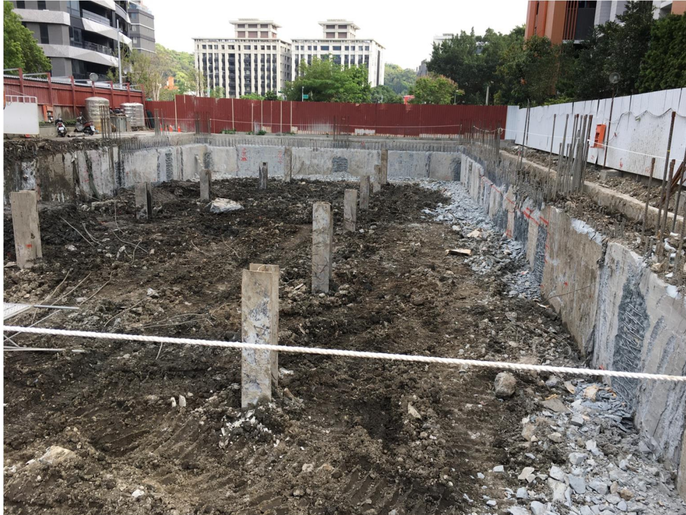
第一層土方開挖完成