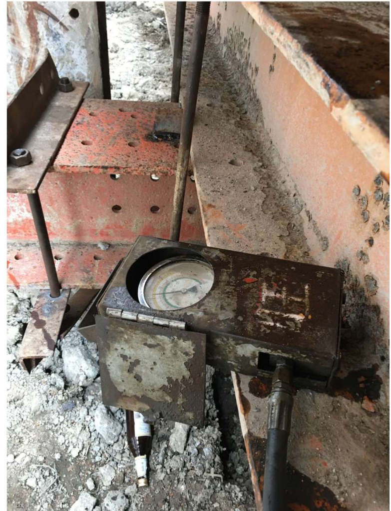
油壓機及土壓計(安裝完,油壓機加壓千斤頂,土壓計顯示千斤頂壓力)