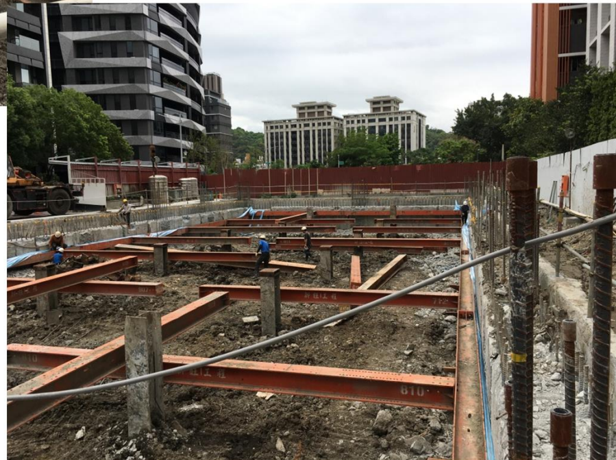
安全支撐鋼構材料進場並組裝