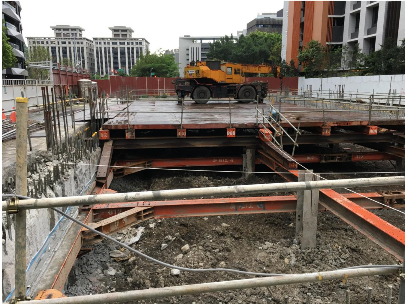
安全支撐及構台完成