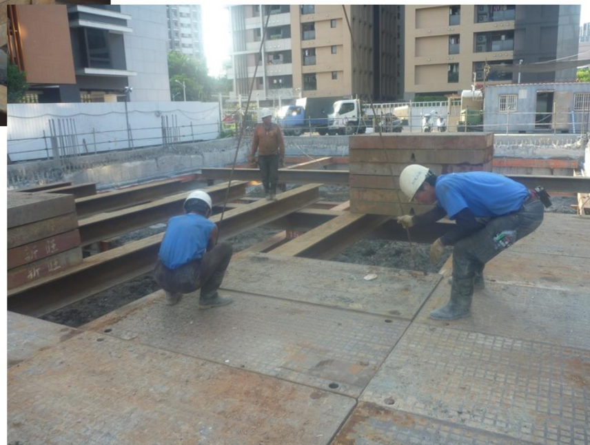
安全支撐構台安裝