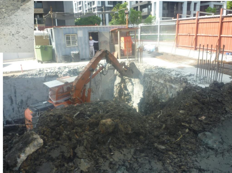
連續壁內導溝挖除