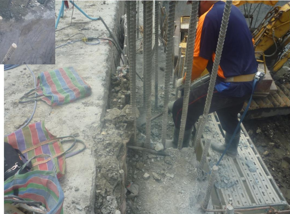
連續壁頂劣質混凝土打除