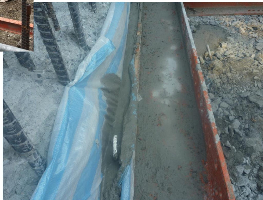
安全支撐圍令與背填RC