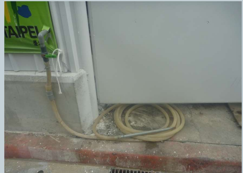
大門口清潔給水安裝