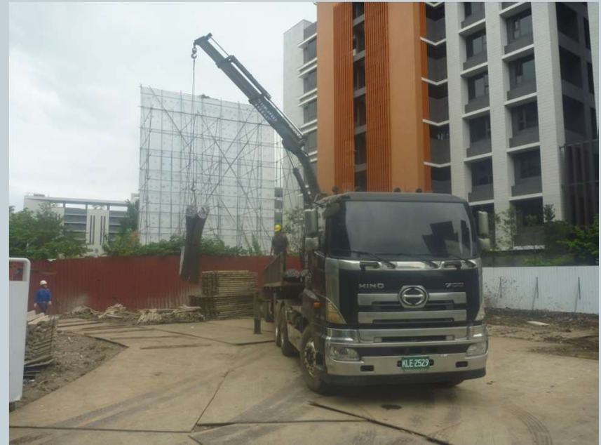
連續壁導溝用鋼筋進場