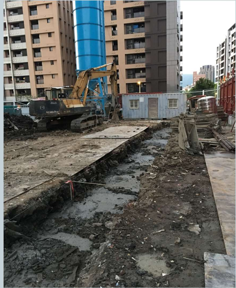
連續壁導溝 施作處地質改良