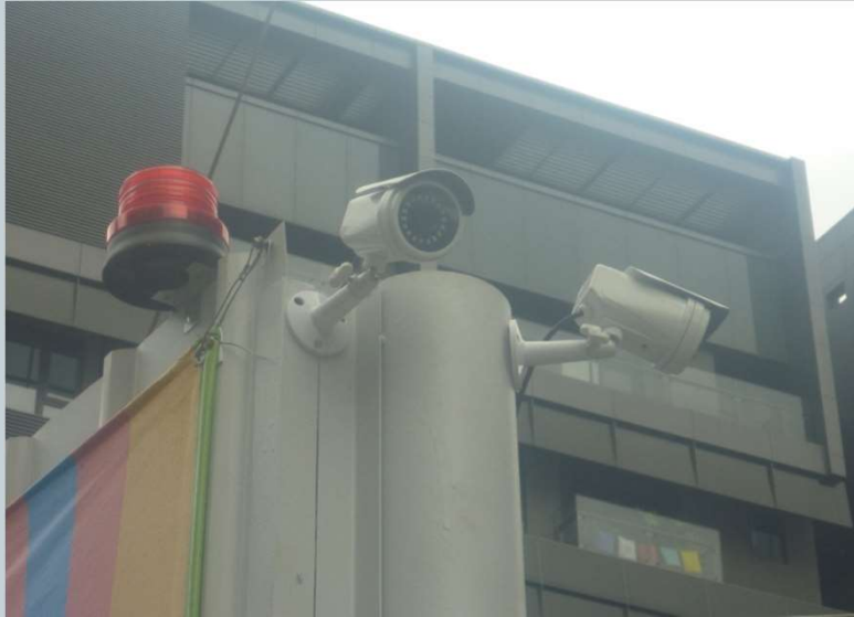
大門口監視器安裝