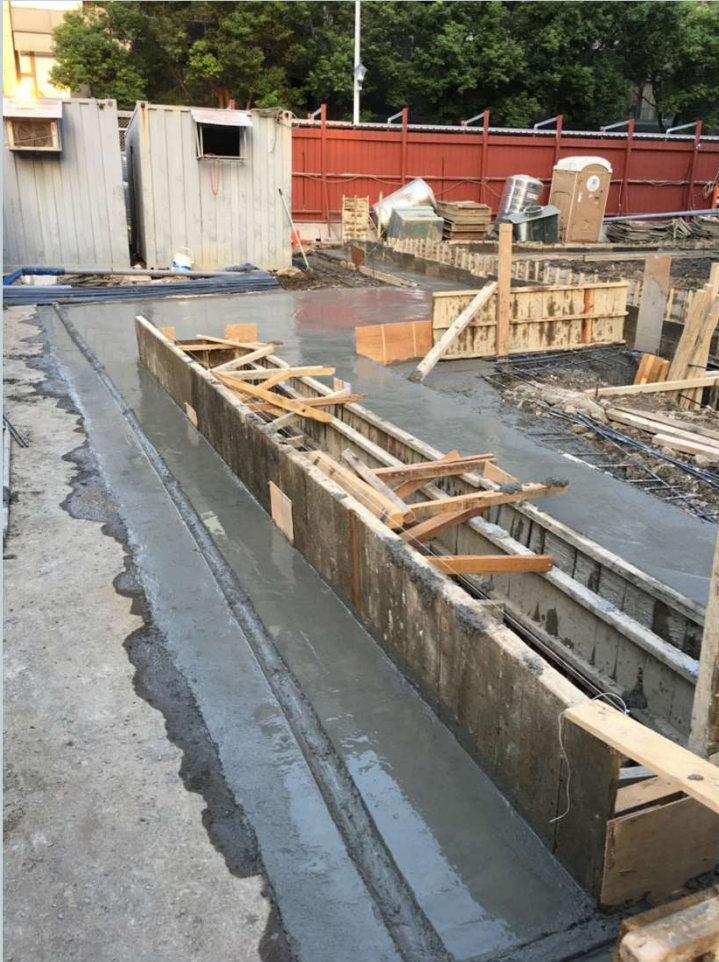
導溝與洗車台收頭