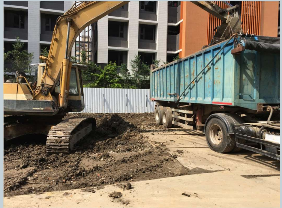
連續壁導溝施作開挖